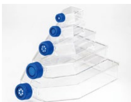
細胞培養フラスコ