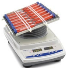
オープンエアローッカー