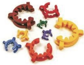
ジョイントクランプ