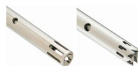
ステンレス プローブ