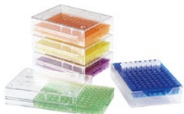
Low-Temp PCR チューブラック