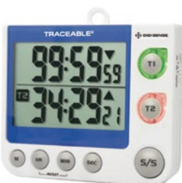
Big-Digit 2チャンネルタイマー