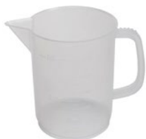
ハンドル付きポリプロピレン製 ビーカー