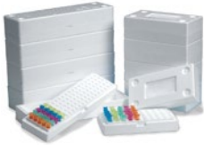
フォームチューブラック