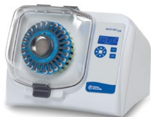
Bead Mill 24