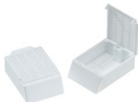
MACROSETTE 深型包埋カセット白