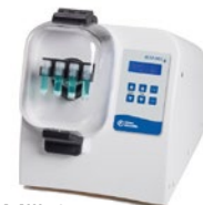
Bead Mill 4