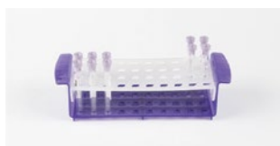
ローテートチューブラック