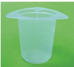
トリコーナードイスポビーカー