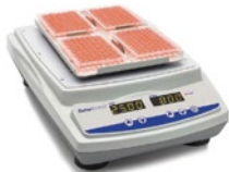
マイクロプレートシェーカー