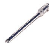
ディスポーザブル プローブ