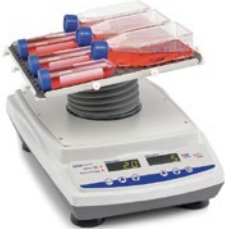
マルチファンクション 3Dローテーター

連続運転、時限運転、さまざまな組み合わせで、あらゆる用途に最適な 3D ローテーター