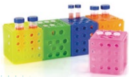
キューブチューブラック