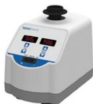
デジタルボルテックスミキサー