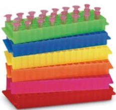
マイクロチューブラック