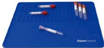
クリニカルラボマット