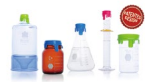
Kimble Silicone Lids