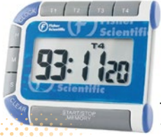
Traceable マルチカラータイマー