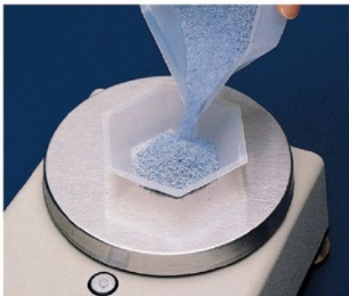
ポリスチレン製六角秤量皿