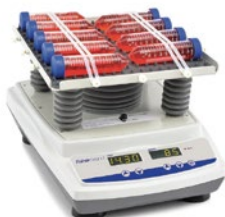
ウェーブモーションシェーカー