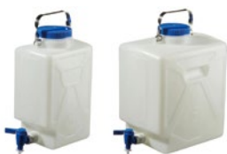
角型カーボーイ 活栓付