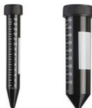
コニカルチューブ