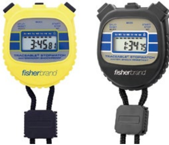
Traceable 防水ストップウォッチ