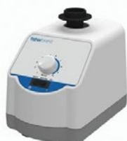
アナログボルテックスミキサー