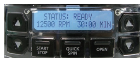
簡単操作パネル、見やすいデジタルディスプレイ