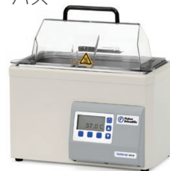
2L (浅型) /5L