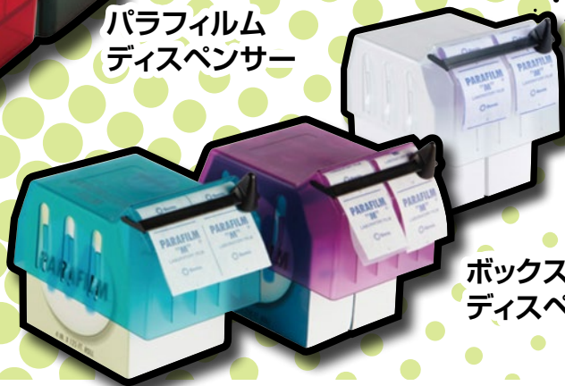
ボックスストップ ディスペンサー