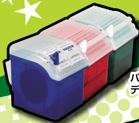
パラフィルム ディスペンサー